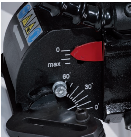
Réglage d'angle continu de 0 à 60°