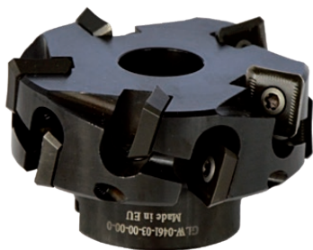
Tête monobloc avec 10 plaquettes de coupe, serrées par vis.

Guide standard universel pour le chanfreinage de tôles plates et tubes Ø 150-300mm (6-12")